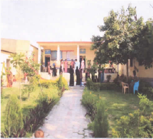
आयएसओ आंगणवाडी अब्दीमंडी

२ ऑक्टोबर २०११ रोजी अब्दीमंडी या गावातील तीन अंगणवाडी केंद्रांना आय.एस.ओ. ९००१ -२००८ हे आंतरराष्ट्रीय दर्जाचे मानांकन मिळवून देऊन एक नवीन इतिहास रचला .