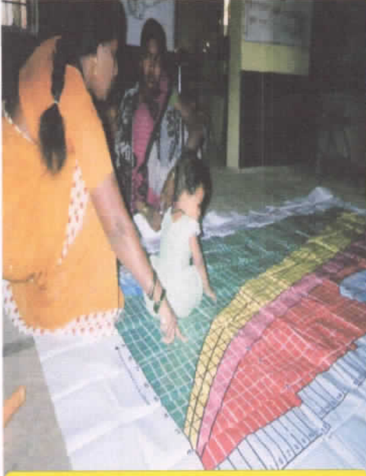
आंगणवाडीत मातांना मुलांच्या वजना संदर्भात माहिती देतांना